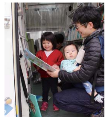
「はじめてのえほん」「はじめてのものがたり」のコーナーでは、親子で本の世界を楽しめます

A. 生活・趣味・子育てなどに役立つ実用書や小説、絵本や児童書など、いろいろなジャンルの本が約3,000冊揃っています。図書館司書が取り揃え、毎回入れ替えている選り抜きの本ばかりです。