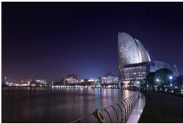
「現代の帆船」 加藤縁さん 撮影場所:臨港パーク