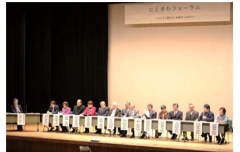
各地区の代表が地域の課題を講師とお話します

※一時託児(2～5歳)、手話通訳などの配慮が必要な場合は2月1日(金)までにご連絡ください。 ※当日の開催可否は、横浜市コールセンター(☎664-2525 8時から)、ホームページおよびTwitterでお知らせします。