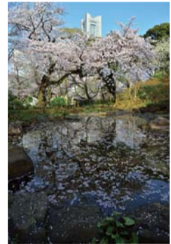
第43回西区民まつり(11月4日開催)来場者投票で決まりました。