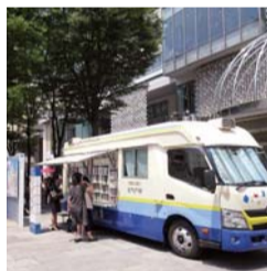
ビジネス街のお昼休みに本と触れ合えます

日時 隔週金曜日 (1月11日、25日、2月8日、22日(金)) 11時50分~12時50分