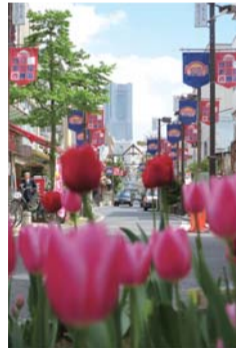
「春のチューリップ」 たろうさんさん 撮影場所: サンモール西横浜