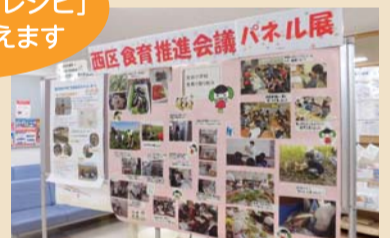
保育園や小学校などでの活動を写真で紹介します

日時 2月15日(金)～26日(火) 場所 区役所1階区民ホール 地域での食育の取り組みを紹介します。